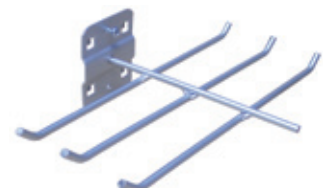
Trensenhalter ■ sechsfach, 150 mm lang