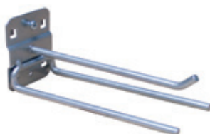
Trensenhalter ■ dreifach, 150 mm lang