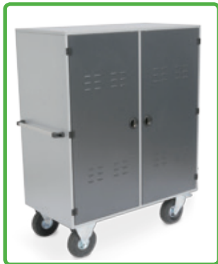
Lieferung ohne Zubehör