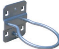
Rundhalter ■ Ø 60 mm